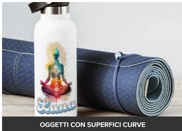
OGGETTI CON SUPERFICI CURVE