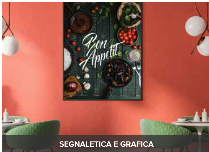
SEGNALETICA E GRAFICA